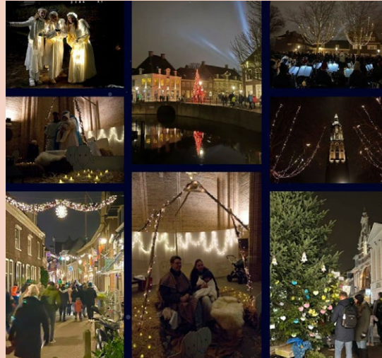
Ook de kerstlichtjestocht heeft een bijdrage uit het buurtbudget 2023 aangevraagd.

Het aanvraagformulier voor een bijdrage uit het buurtbudget 2024 staat alvast op onze website www.bbn-amersfoort.nl . Aanvragen voor een bijdrage uit het buurtbudget 2024 moeten voor 11 maart 2024 binnen zijn bij de buurtbudgetcommissie van de binnenstad. Dit wel onder voorbehoud, wij wachten nog op goedkeuring van onze eigen aanvraag bij de gemeente Amersfoort om ook in 2024 te beschikken over buurtbudget voor de binnenstad.