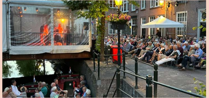
Ook de Havikconcerten hebben een bijdrage uit het buurtbudget 2023 gekregen.

Voor de binnenstad en voor de wijken Kruiskamp/Koppel en Liendert/Rustenburgerburg zorgt de Stichting Buurtbudget Midden Nederland voor het aanvragen van het buurtbudget bij de gemeente Amersfoort. Dit dient voor 1 oktober 2023 gedaan te zijn. De buurtbudgetcommissie hoopt voor 2024 hetzelfde bedrag beschikbaar te krijgen als voor het huidige jaar.