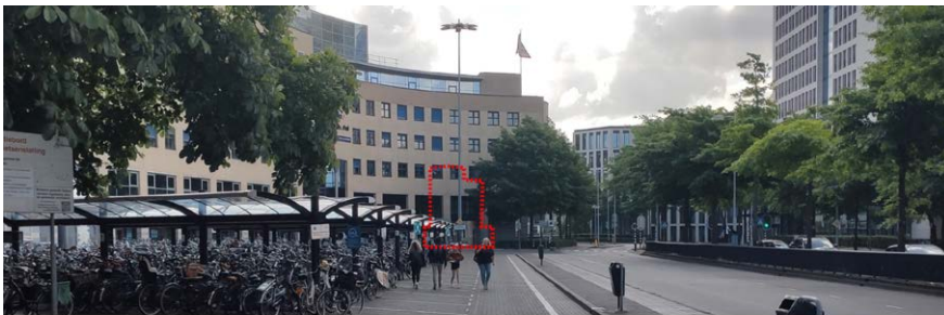
'Sam' als baken op de route van station naar binnenstad? Niet zichtbaar bij verlaten station en vanaf bewegwijzering voor wandelaars ('Sophietjes').

Tekst: Johan Riemersma, visualisatie: Vincent Veneman