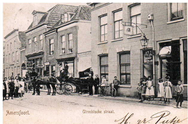
Hetzelfde deel van de straat, maar nu uit de tijd van paard en wagen.

Het pand is in de loop van de jaren 60 afgebroken om plaats te maken voor het pand van de Hema aan de Utrechtsestraat. Waar nu warme broodjes en halve rookworsten worden verkocht, bevond zich de winkel van mijn grootvader.