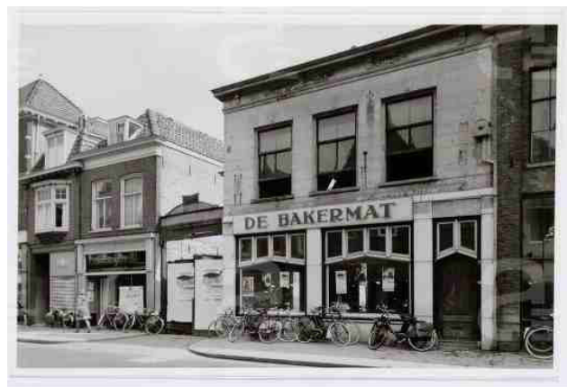
Het pand Utrechtsestraat 16, links op de foto, vlak voor de afbraak.

Als kind kan ik mij eind jaren 50, begin jaren 60 van de vorige eeuw zijn winkel aan de Utrechtsestraat 16 nog herinneren. Hij verkocht speelgoed, scherts- en fopartikelen zoals jeuk- en niespoeder, nepspinnen en meer van dat soort spul. Daarnaast handelde hij in sportprijzen, zoals medailles en prijsbekers.